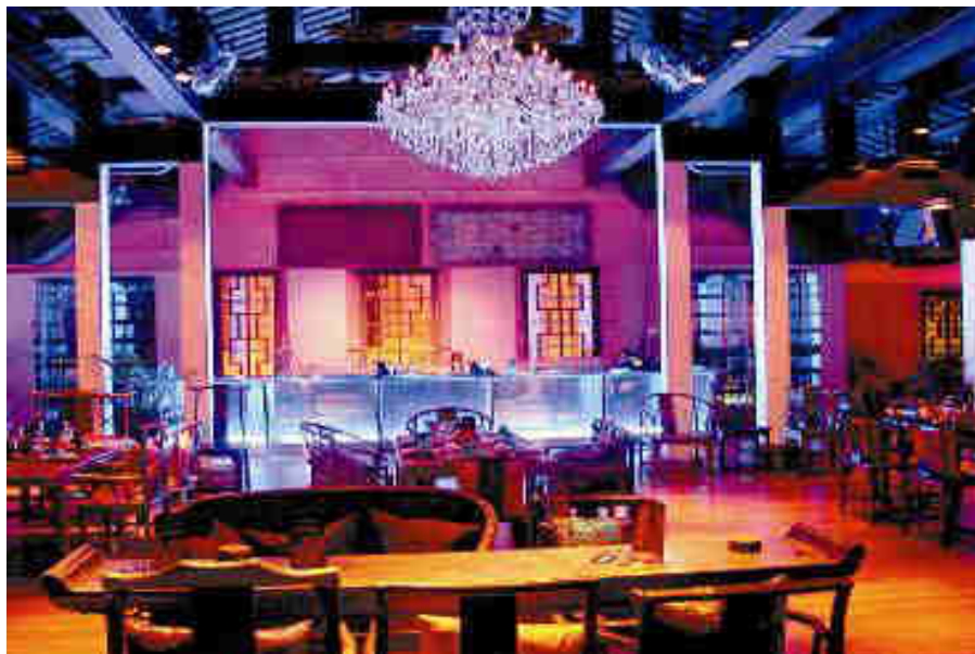
THE FORBIDDEN CITY CLARKE QUAY IndoChine Singapore