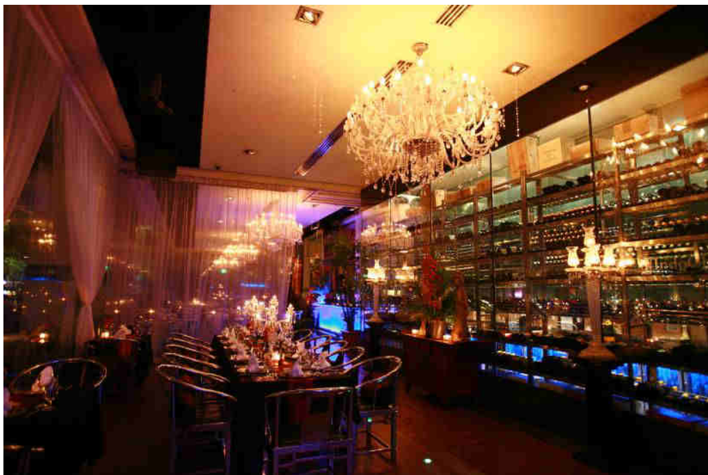
WATERFRONT RESTAURANT EMPRESS PLACE IndoChine Singapore

Havana Club Anejo Especial & 7 Años Rum, Myers's Rum, Old Pascas 73%, Crème de Cassis 1, Lemon Squash, Maracujasaft